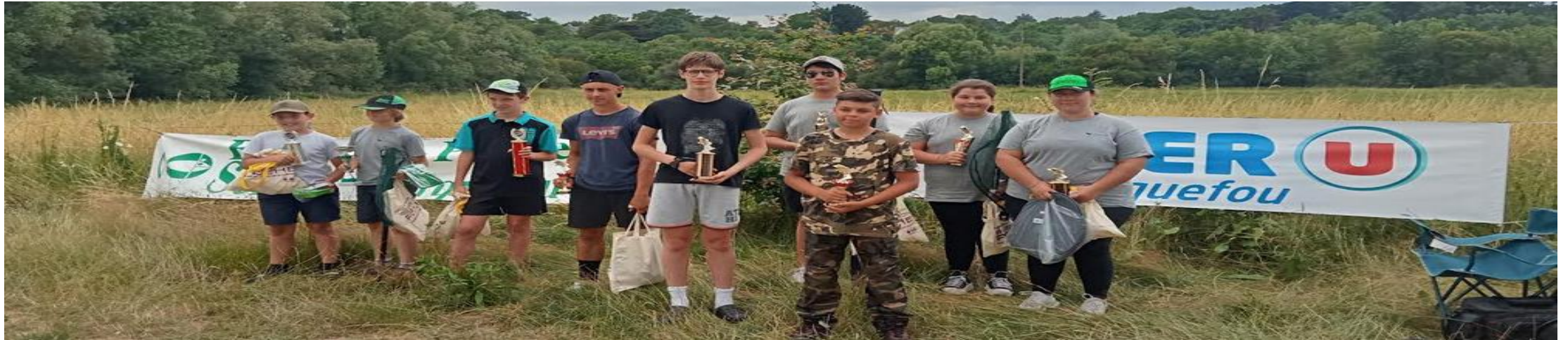
concours 17 Juin 2023